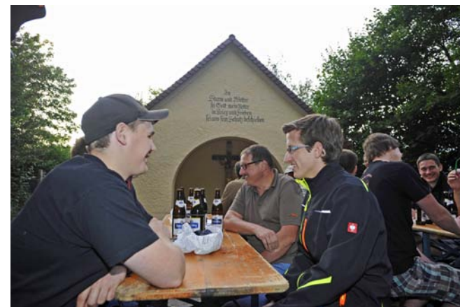
Kolpingbrüder bei der neu renovierten Schächerkapelle.

verantwortlich leben solidarisch handeln