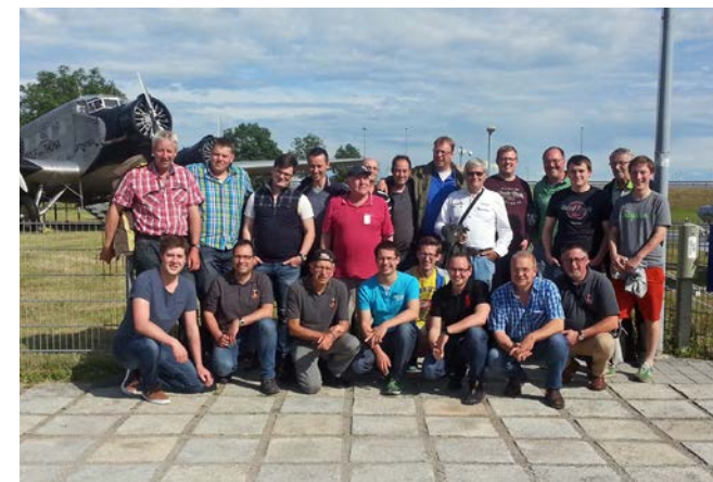
Jahresausflug 2016 nach München

27.10. Weltgebetstag der Kolpingsfamilien im Bezirk Schwarzwald- Baar (KF Brigachtal)